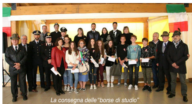
La consegna delle "borse di studio"

Le note del Gruppo Bandistico Orione di Borgonovo Val Tidone, hanno accompagnato il corteo che ha sfilato per le vie del paese.