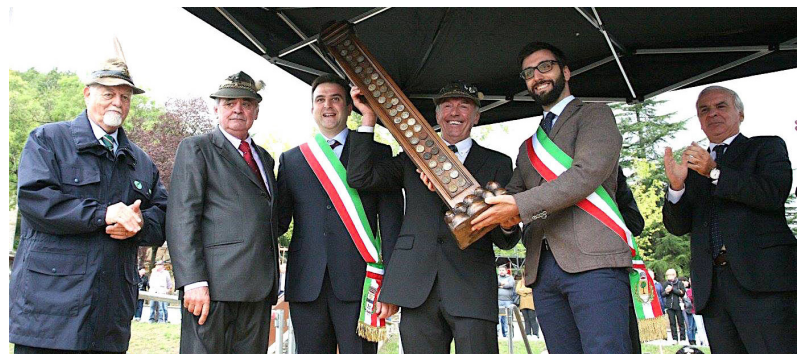
Il passaggio della "Stecca"