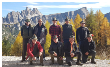
Sui luoghi della memoria Cinque Torri e Lagazuoi