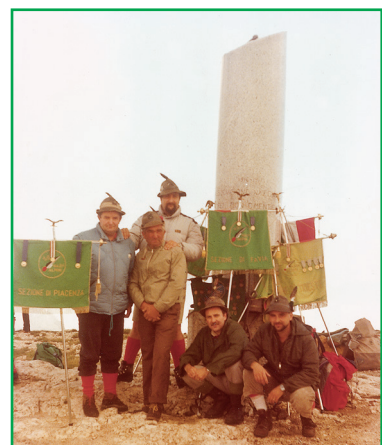
La prima volta del gagliardetto alla colonna mozza

cheggio da dove si è proseguiti a piedi per raggiungere P.le Lozze dove vi sono un piccolo rifugio gestito dagli Alpini di Marostica e la chiesetta che rac-