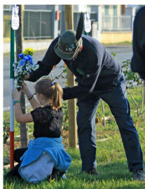
Deposizione fiori sulle stele dei Caduti

La deposizione di fiori da parte dei ragazzi delle quinte elementari accompagnati da insegnanti, alpini e amministratori comunali, sulle stele dei caduti della grande guerra.