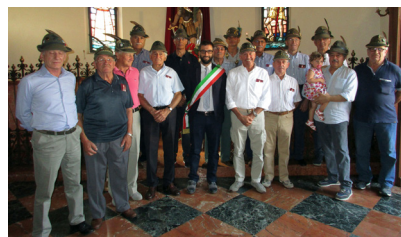
Finanziato il restauro della statua del Patrono