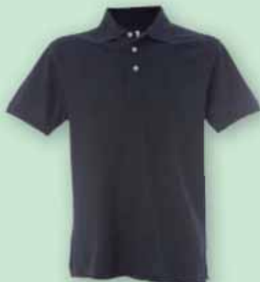
Polo a manica corta 100% cotone. Colore blu. 15 €