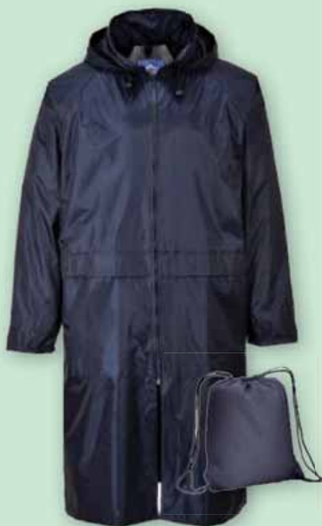
Impermeabile lungo con cerniera e cappuccio. Colore blu. Completo di borsa/zainetto. 25 €