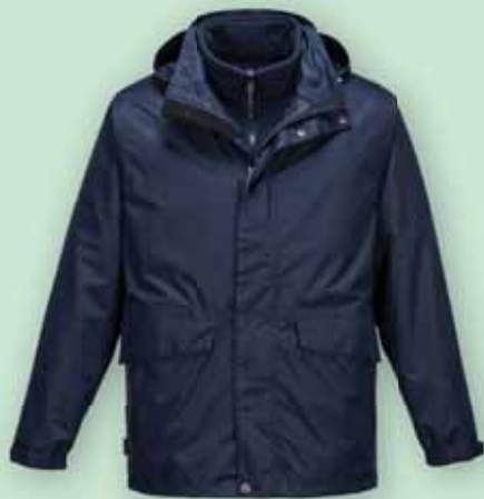
Giacca impermeabile sfoderabile con pile interno. Colore blu. 80 €

Presso la sede sezionale si possono prenotare i capi di abbigliamento scelti dal Consiglio Direttivo. Su ognuno di essi sarà applicato il nuovo logo sezionale.